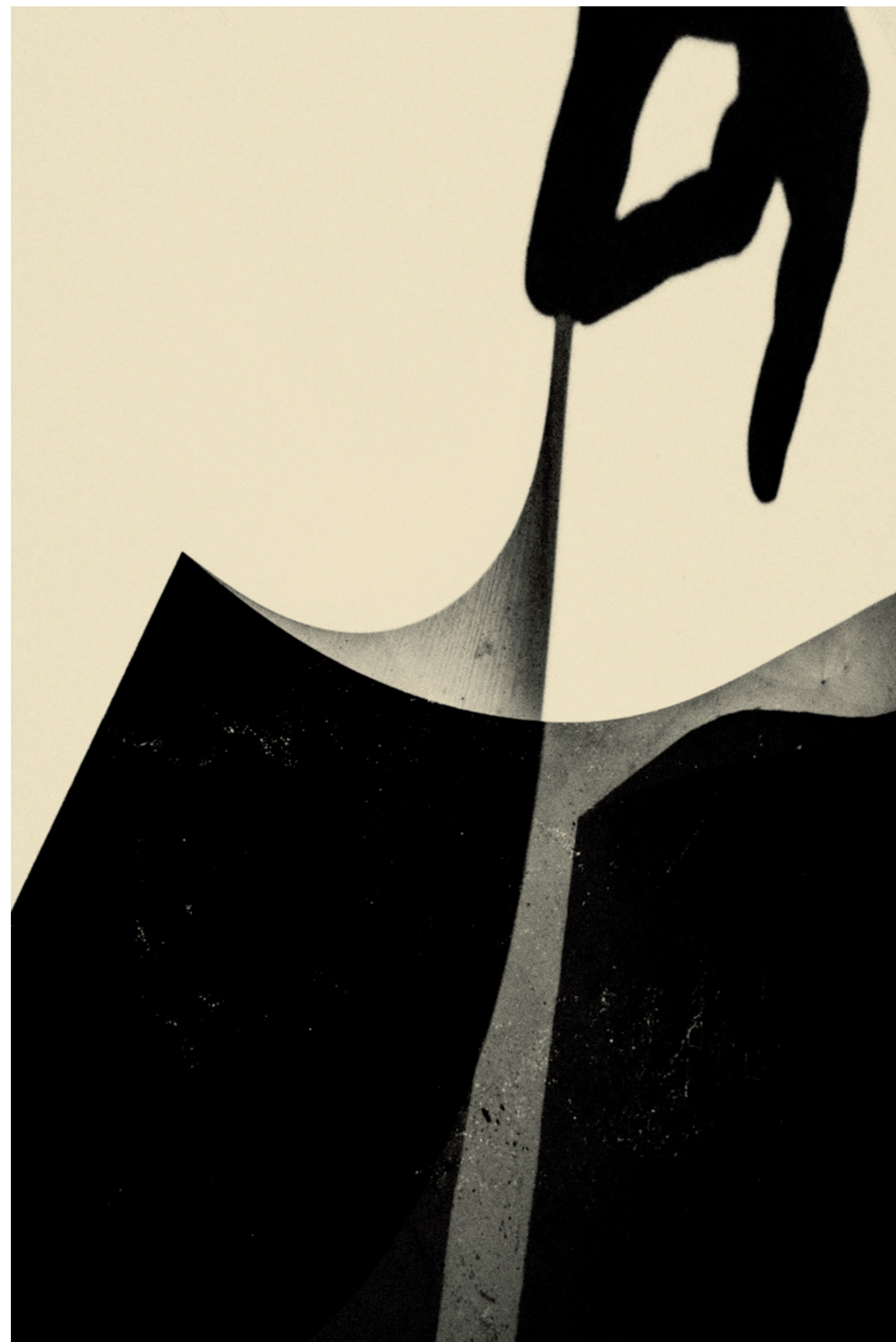
'Ishikawa', 2019. Cupido heeft veel in Japan gefotografeerd.

Fotograaf Paul Cupido wil laten zien dat alles er maar even is en dat daar schoonheid in schuilt.