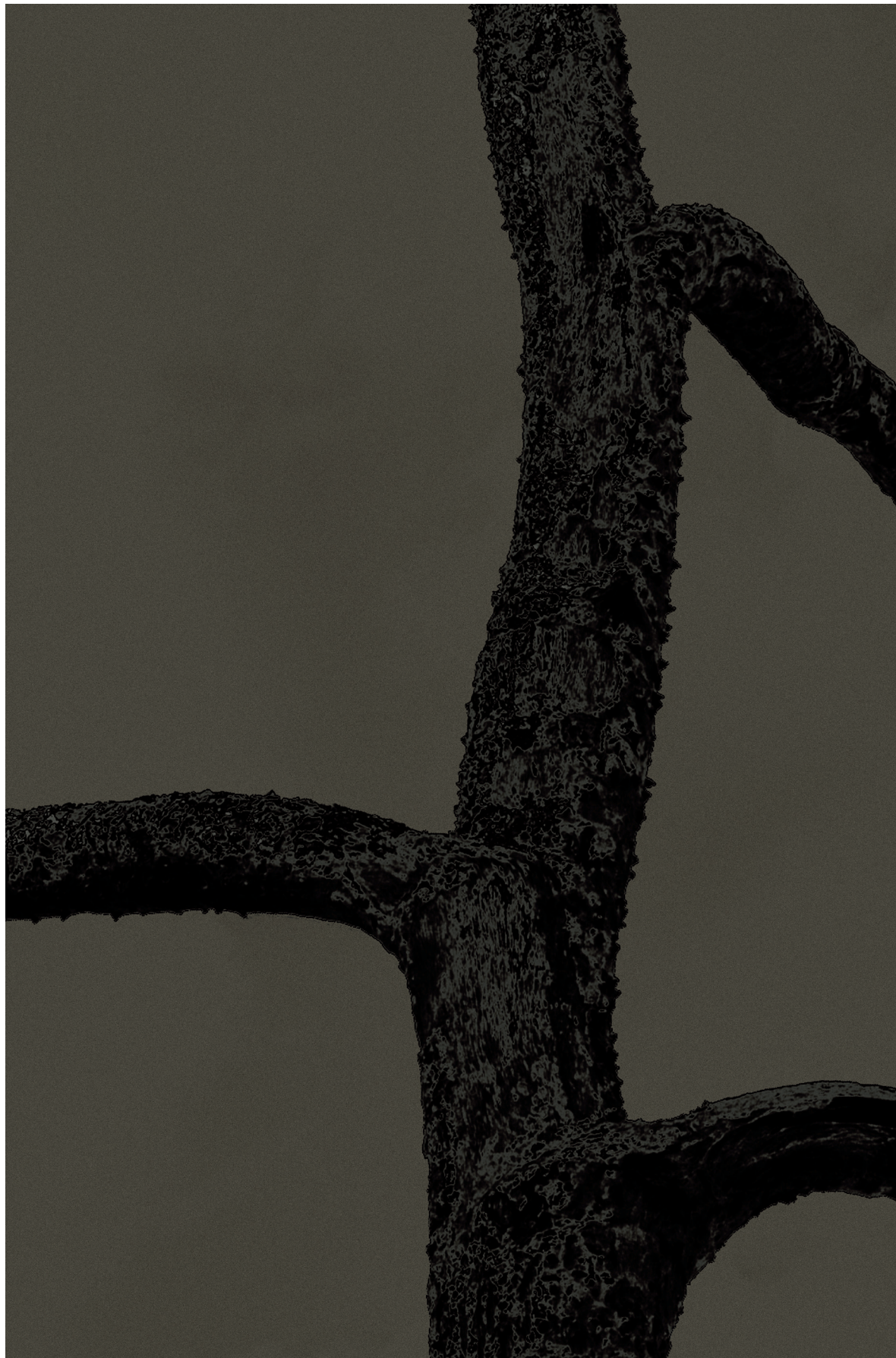
‘Arbre Umbra’, 2019.

Tijdens zijn zwerftocht van Tokio naar het noordelijkste deel