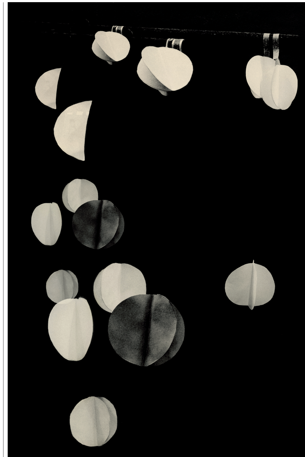
'Ma Continuum', 2018.