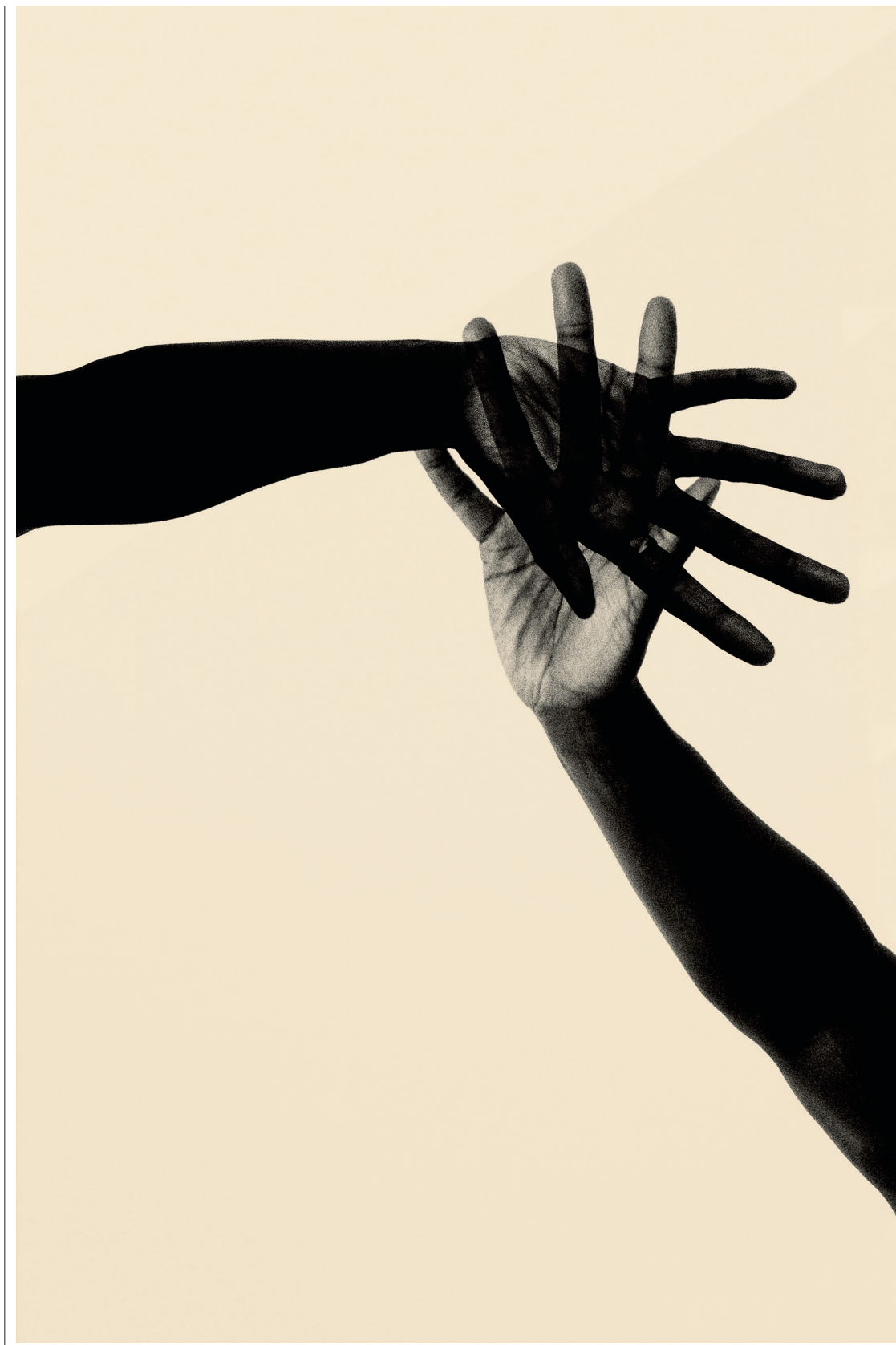
‘Hands Together’, 2018.

van de Japanse archipel vond hij het thema voor zijn fotografie. Zijn foto's gaan over sterfelijkheid, maar ze zijn niet somber, eerder troostend.