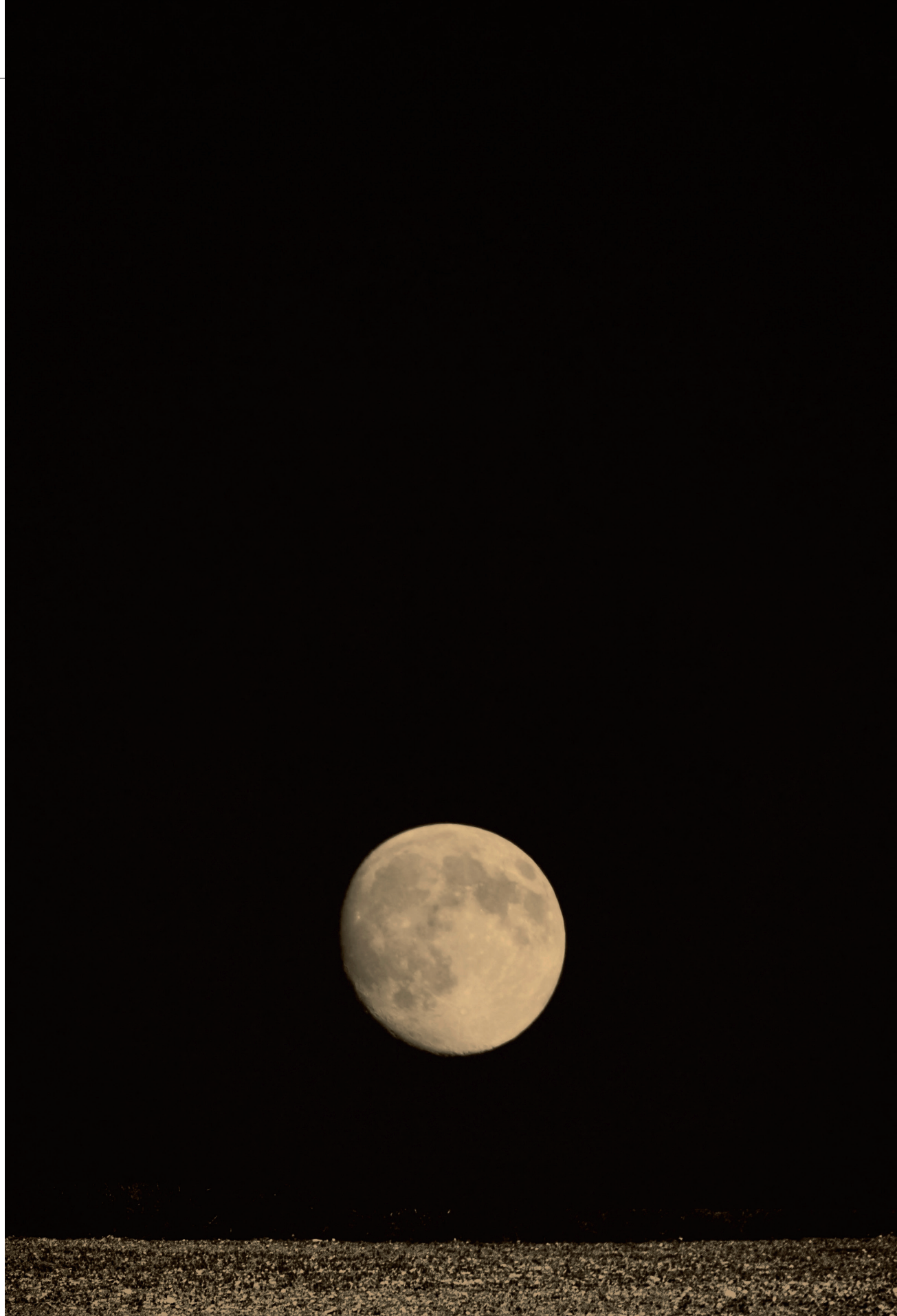
'An Island in The Moon I', 2020. De maan komt veel voor in het werk van Cupido.