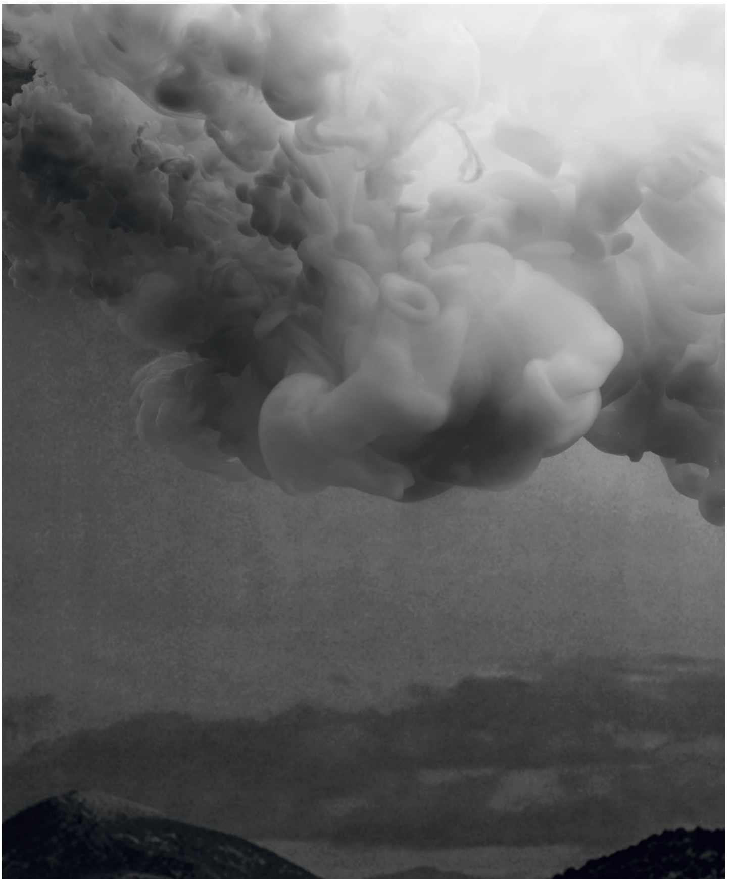
Promised Land, Cumulus (Volute), 2013 Archival pigment print 90 x 110 cm Edition 3 of 7 & 2 AP