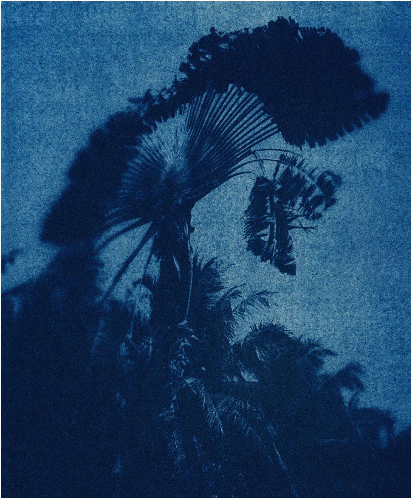
Five Minutes to the Sun, Ravenala, 2014 Archival pigment print 80 × 110 cm Edition 3 & 2 AP