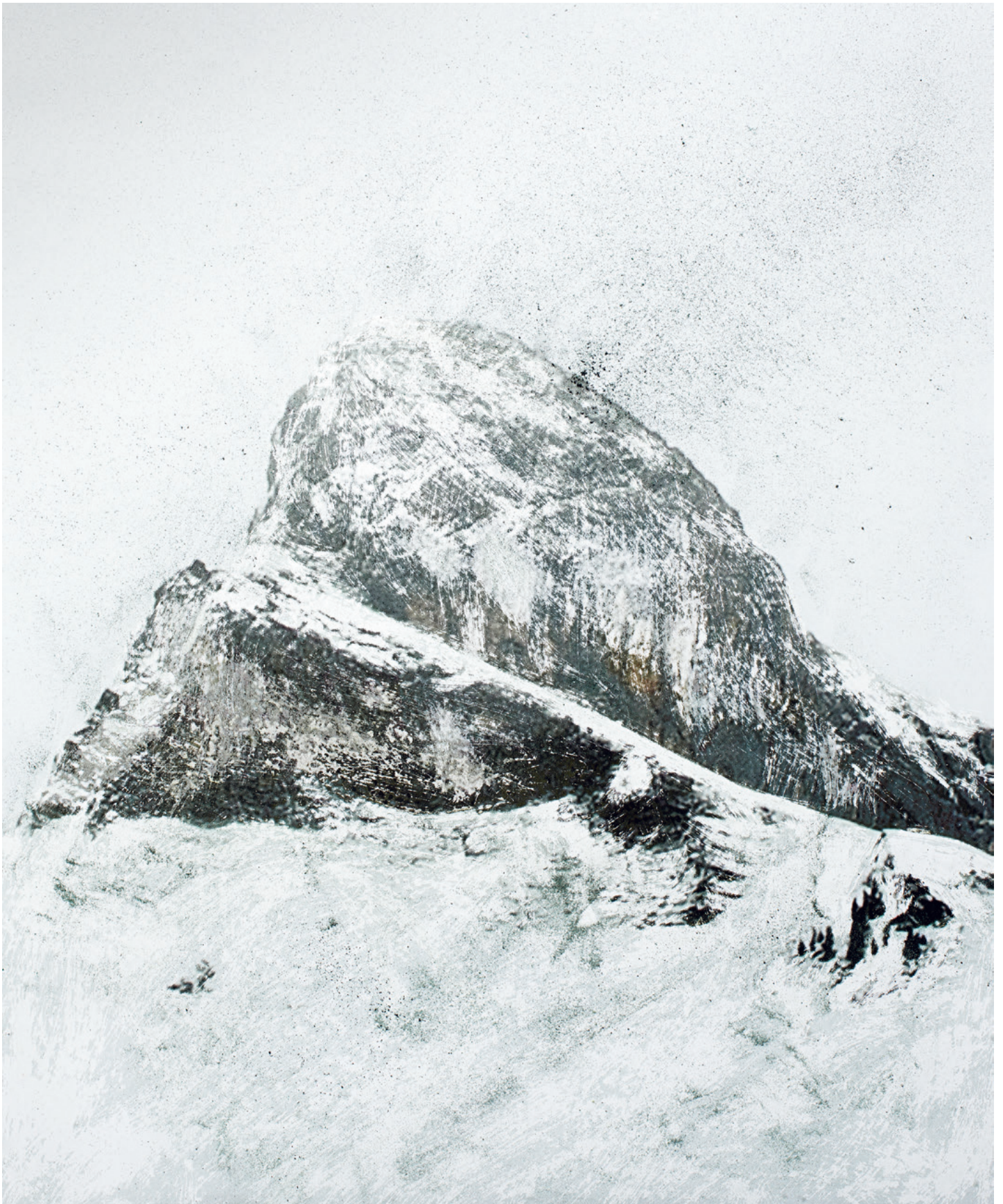
Promised Land, Montagne III (Rubbing), 2013 Archival pigment print 90 × 110 cm Edition 5 of 7 & 2 AP