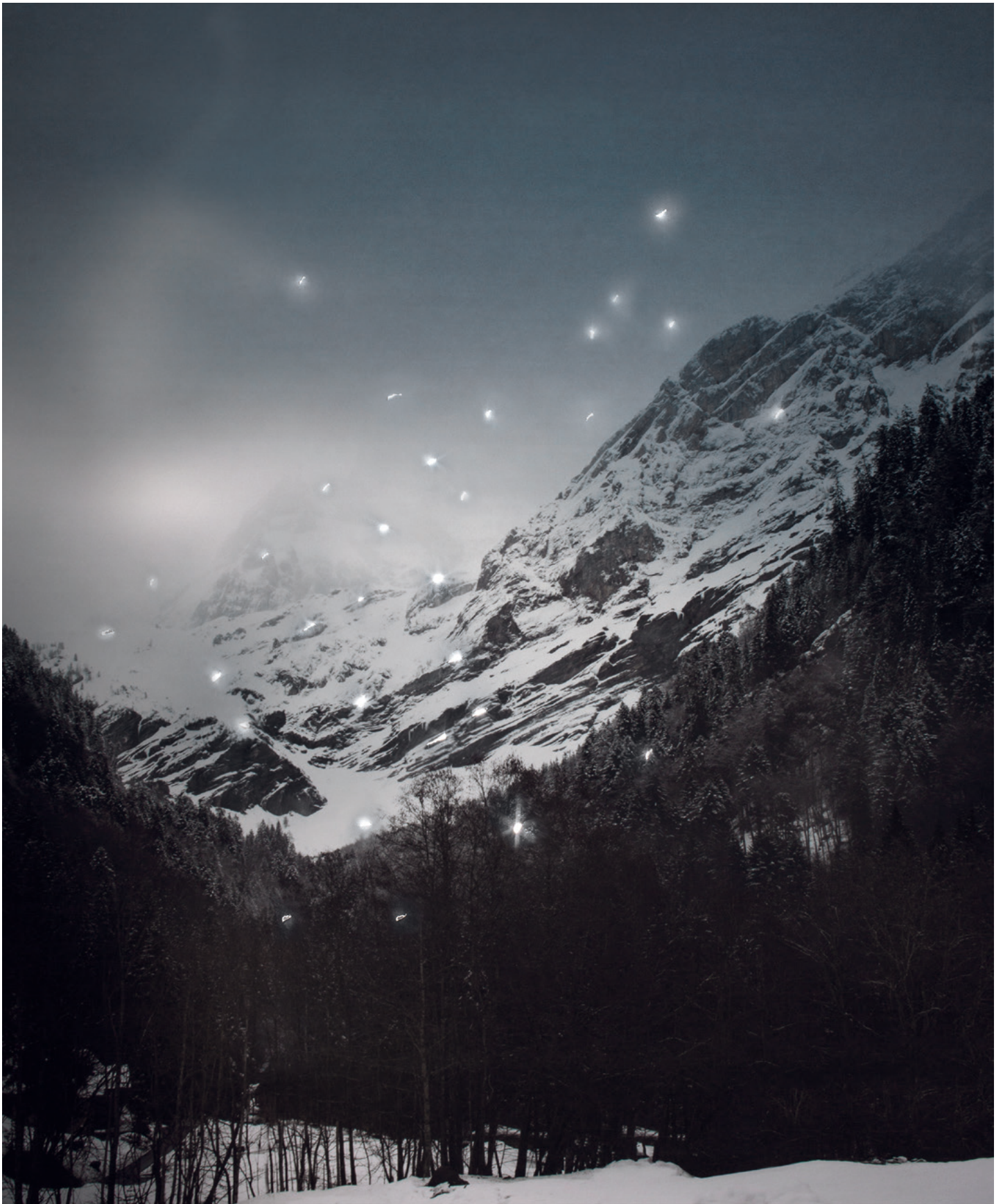
Promised Land, Montagne II (Ponctions), 2013 Archival pigment print 90 × 110 cm Edition 3 of 7 & 2 AP