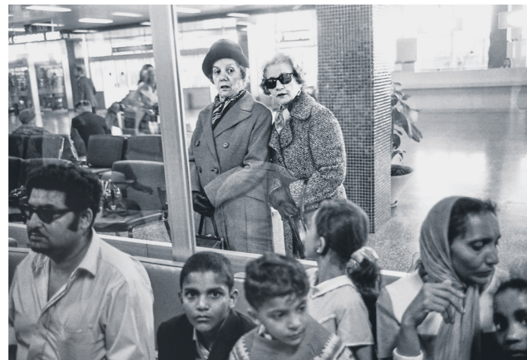
ANKUNFT TAMILISCHER FLÜCHTLINGE

«In den 70ern gab es sehr viel so sexy Zeug; die Nachtclubs, hüllenlose Modenschauen, Fotosalons wie das «Klick und Fick». Diese Offenherzigkeit und Freizügigkeit war damals neu. Diese Frauen hier, angestellt zur Lancierung eines Pornohefts, waren am Ende des Abends lange nicht mehr so zugeschnürt wie auf diesem Bild.»