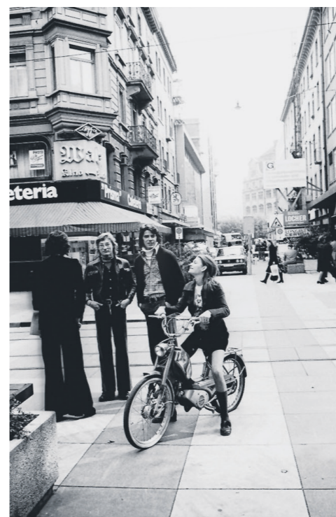
MIT DEM NEUEN MOFA AN DER BAHNHOFSTRASSE

«Es war der Beginn der tamilischen Flüchtlingsbewegung, als ich an den Flughafen geschickt wurde, um diese zu dokumentieren. Ich hätte die Menschen auch mit ihrem ganzen Hab und Gut in der Ankunftshalle zeigen können oder ihr Leben in der Stadt. Doch für mich war dies das Bild, das alles aussagt: wie die Neuen auf die Einheimischen treffen. Und es erzählt symbolisch eine Geschichte der Skepsis gegenüber dem Fremden; auch wenn die Frauen vielleicht gar nicht so argwöhnisch waren, wie es hier scheint.»