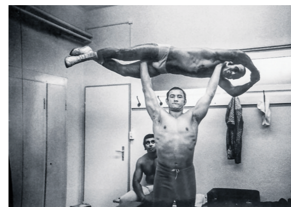
«WÜRGER VON LISSABON» GEGEN DEN «BLAUEN ENGEL VON PARIS»

Neben Willy Spillers Bildern sind auch Fotografien von Fred Mayer («Zürcher Panoptikum») ausgestellt.